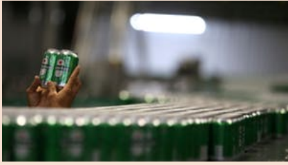
Heineken sluit miljardendeal in China