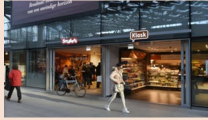
NS hoeft eindelijk geen hamburgers meer te bakken