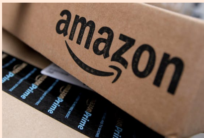
Duitsland bereidt wetgeving voor die webwarenhuis Amazon en andere onlineplatformen aansprakelijk maakt voor de btw-afdracht van handelaren die gebruikmaken van hun websites.

De Bondsregering heeft woensdag ingestemd met een wetsvoorstel dat moet voorkomen dat buitenlandse handelaren, vooral afkomstig uit het Verre Oosten, wel omzetbelasting in rekening brengen over verkopen in Duitsland maar die niet afdragen aan de Duitse fiscus. De regering zegt zo jaarlijks honderden miljoenen aan 'Mehrwertsteuer' mis te lopen. De Bondsdag moet nog met de wet instemmen.