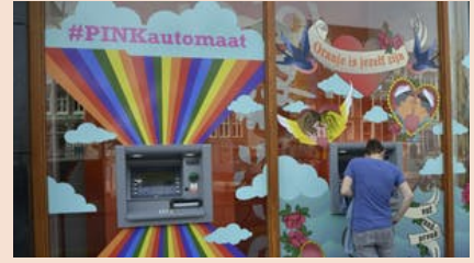
Pride Amsterdam heeft bedrijfsleven hard nodig